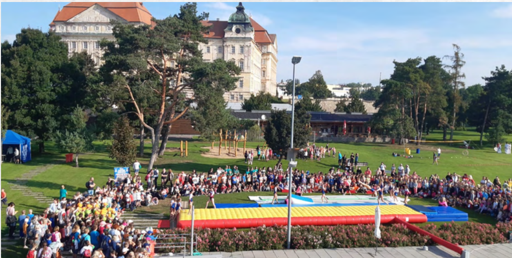
Vystoupení Klubu sportovní gymnastiky při zahájení Louky plné dětí