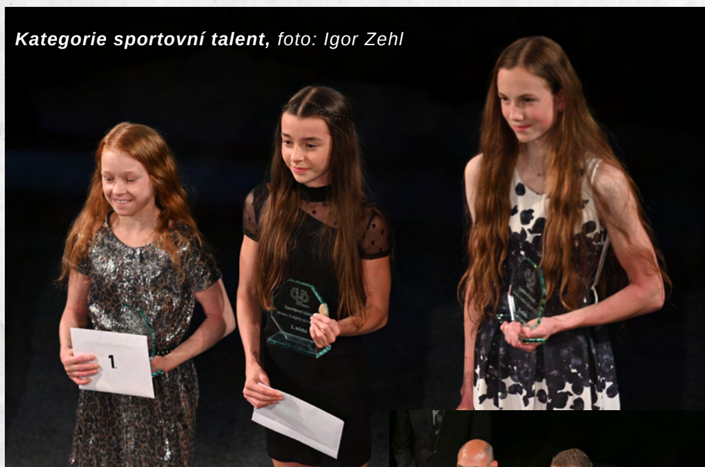
Kategorie sportovní talent