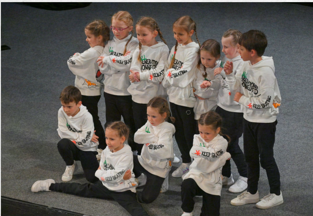
Malí tanečníci ze skupiny Mighty shake