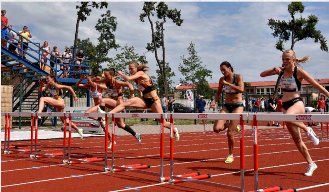
Běh na 400 metrů překážek, ženy , foto: Josef Petrica