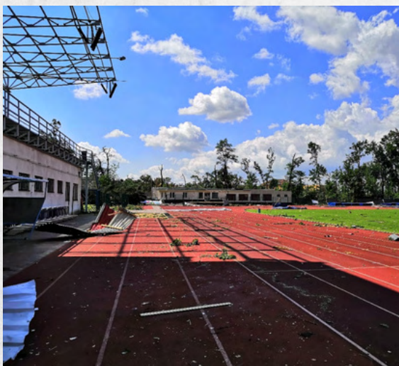
Stadion u červených domků poškozený tornádem

Přesně rok po události se zde sjeli ti nejlepší atleti, aby se porvali o titul Mistr České republiky. Lákadlem byla taková jména jako Špotáková, Vadlejš, Svoboda, Maslák, Kudlička a spousta dalších vynikajících atletů.