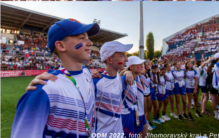
ODM 2022