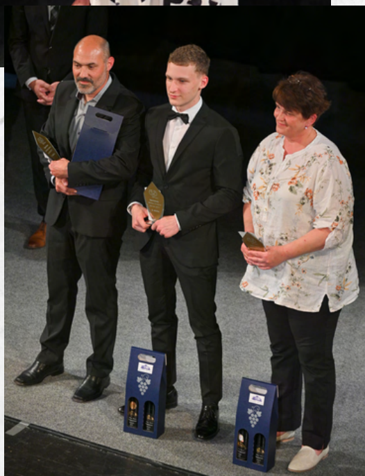
Kategorie Sportovec okresu (2 zastoupení)

Galavečer několika větami zakončili starosta města Znojma Jakub Malačka, náměstek hejtmána JmK Lukáš Dubec a předseda Okresního sdružení ČUS Znojmo Zdeněk Kolesa.