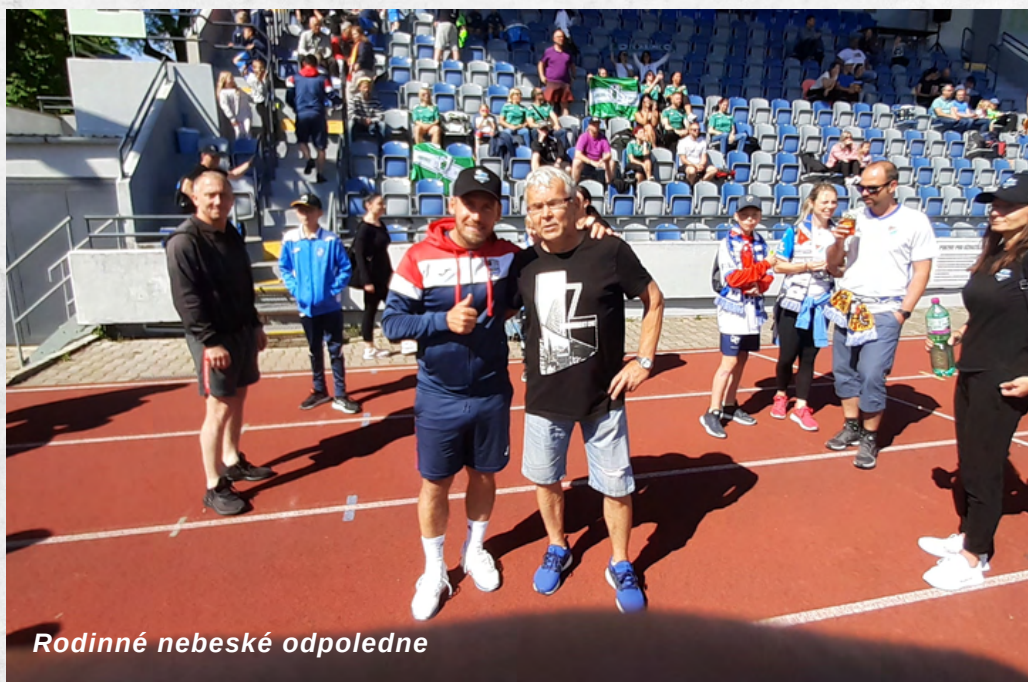
Rodinné nebeské odpoledne

Město Znojmo dostalo možnost za spolupráce s FK Práche a Fotbalovou asociací České republiky zorganizovat finálový turnaj celorepublikového Planeo Cupu – Poháru mládeže. Všichni organizátoři se zhostili role na výbornou, a ve dnech 27. až 29. května 2022 byl Městský stadion v Horním parku plný fotbalu. Hrála zde věková kategorie U9, a zastoupení mělo také družstvo 1. SC Znojmo – mládež, spolek. Na akci bylo možno potkat i legendu Baníku Ostrava Mirka Matušoviče. Organizace ČUS Znojmo se zapojila nejen organizačně, ale také finančním příspěvkem ve výši 5 000,- Kč.