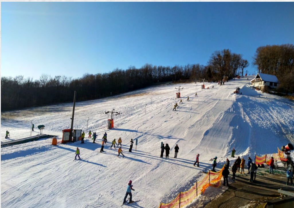
Lyžařský areál Němčičky

Motivem provozovatelů zimních středisek nebo pracovníků horské služby k jejich vydávání skutečně není potřeba omezit naši osobní svobodu, ale snaha zajistit maximální bezpečnost pro všechny návštěvníky. Ne nadarmo platí obecné Desatero – aneb pravidla FIS (Mezinárodní lyžařská federace). Prosím, vyrážíte-li na hory, řiďte se jimi. Přispějete tak svým dílem také k bezpečnějším horám...a nezapomínejte, děti se řídí příkladem.!!