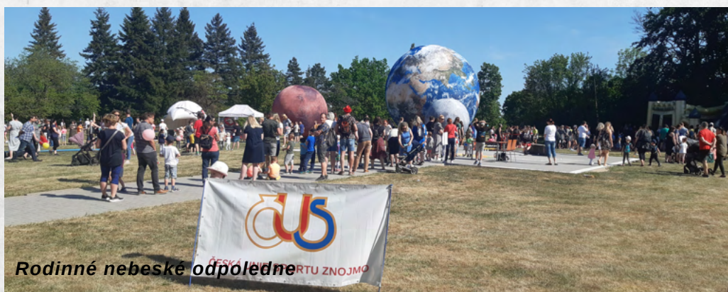
Rodinné nebeské odpoledne

Den před vyhlášením ankety Sportovec okresu, tedy 18. května 2022, byla Znojemskou nemocnicí v tamním parku organizována sportovně-vzdělávací akce s názvem „Rodinné nebeské odpoledne“. Nad touto akcí OS ČUS Znojmo převzalo záštitu, pomohlo s organizací prezentujících se sportů, a podílelo se také finančně. Děti si zde mohly nejen vyzkoušet různé sporty, ale byly poučeny také v problematice poskytování první pomoci, mytí rukou, anatomie člověka a další. Předvedly se záchranné složky RZS, Policie, ale i hasiči se svými ukázkami. Prezentovala se zde také hvězdárna Brno. Na akci se do sportování zapojilo na 650 dětí a celkem se akce zúčastnilo cca 1500 účastníků, kteří mimo jiné ocenili vynikající koláčky od kuchařek z nemocniční kuchyně.