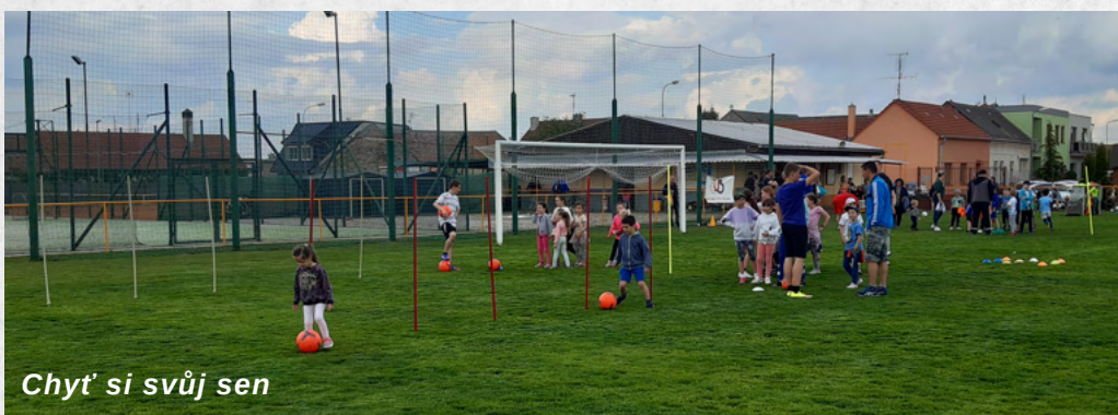
Chyt' si svůj sen

Skvělou akci připravili fotbalisté z Přímětic, kdy se 5. května 2022 na jejich fotbalovém hřišti nejmenší drobotina mohla seznámit s "nástrahy fotbalových překážek", a vyzkoušet si různé obratnosti, přihrávky, střelbu apod., které je v tomto sportu čekají. Na různých stanovištích plnily přítomné děti úkoly s úsměvem i při menších dešťových přeháňkách a potvrdili tím, že je nic nezastaví. A že všichni odcházeli odměněni, to je samozřejmostí, vždyť i naše okresní sdružení tuto akci pod názvem "Chyt' si svůj sen" finančně podpořilo.